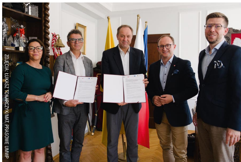
■ Zarząd Województwa Pomorskiego wraz ze Stowarzyszeniem OMG-G-S podpisał umowę na realizację kolejnych 12 projektów w ramach Zintegrowanych Inwestycji Terytorialnych

Do Gdyni i Redy, do szkół podstawowych w Bolszewie, Nowym Dworze Wejherowskim i Wysinie oraz Urzędu Gminy i Biblioteki