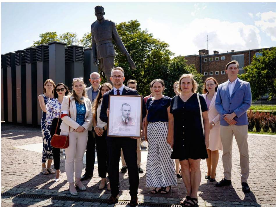
ZDJĘCIA: IPN O. GDAŃSK

■ Pracownicy IPN o. Gdańsk złożyli kwiaty pod pomnikiem Witolda Pileckiego, który znajduje się na placu przed Muzeum II Wojny Światowej