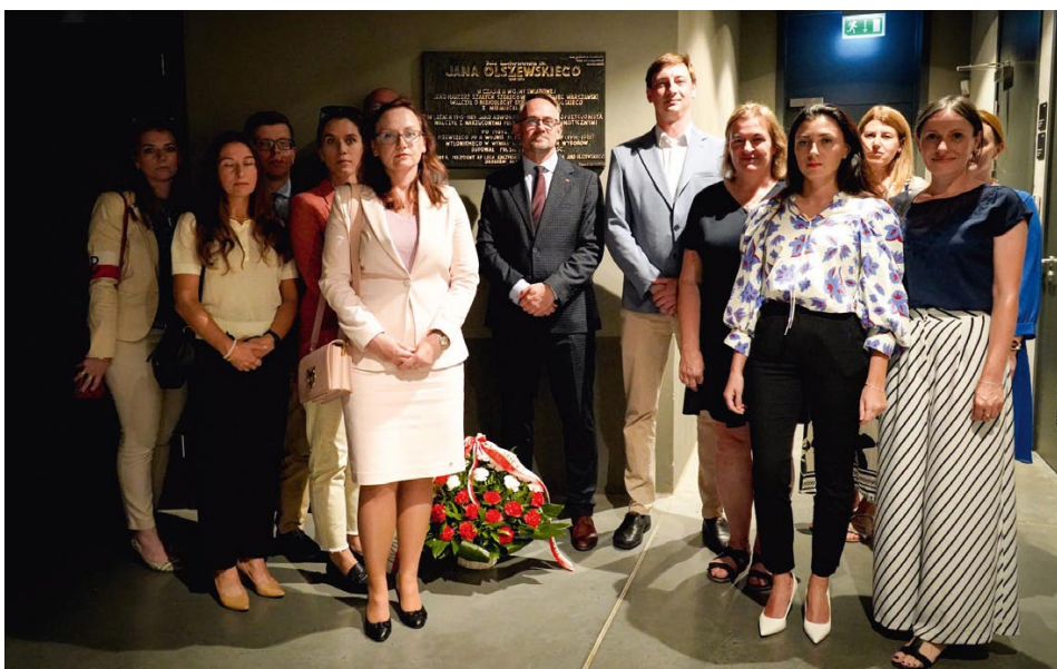
■ Dyrekcja IPN złożyła kwiaty pod tablicą Jana Olszewskiego